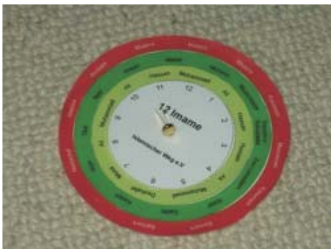
3. Übereinander legen und eine Musterklammer bereit legen