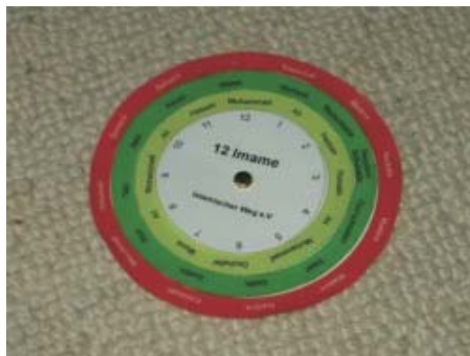
4. An der mit Kreuz markierten Stelle die Kreisscheiben durchstechen und Verbinden